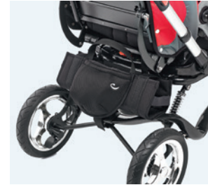
Soporte para botella de oxígeno 8776295 Instalado en las fijaciones para transporte traseras (8720902) Talla única