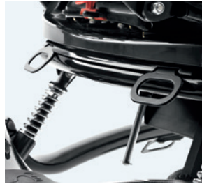
Fijaciones para el transporte 8720902