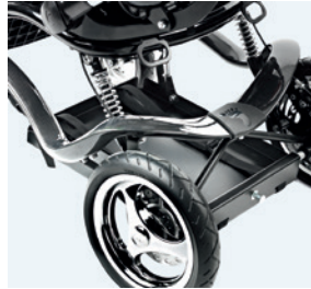
Abertura para bandeja 8776290 Bandeja para transportar equipación médica. Espacio extra, 20 kg. Requiere frenos centrales Tallas Medidas W: 34 x L: 44 cm