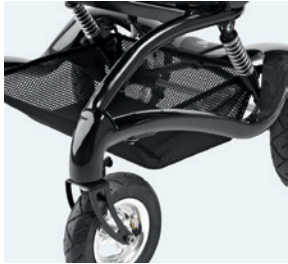
Cesta portaobjetos 8720600 Espacio extra, 10 kg